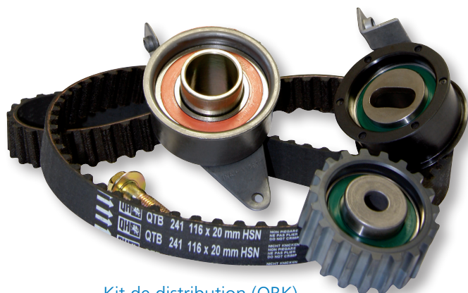
Kit de distribution (QBK)