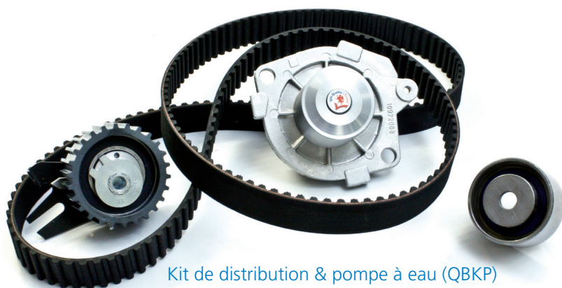
Kit de distribution & pompe à eau (QBKP)